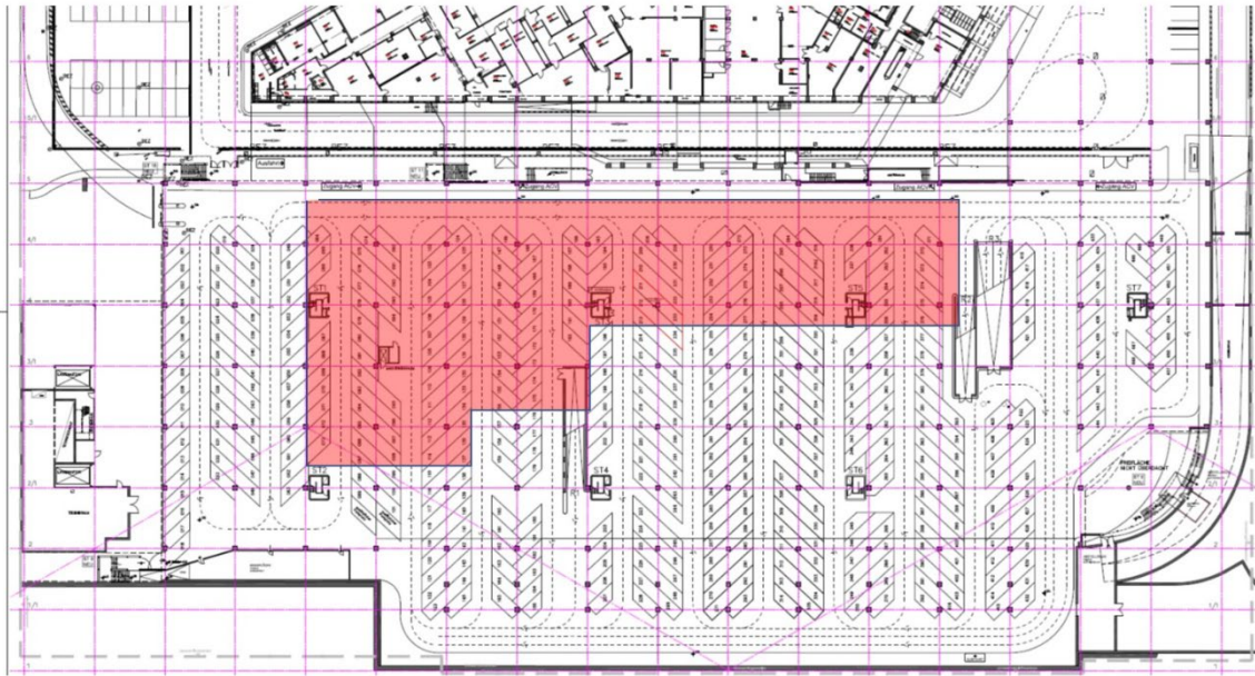
Derzeit gesperrte Bereiche im Parkdeck P2.